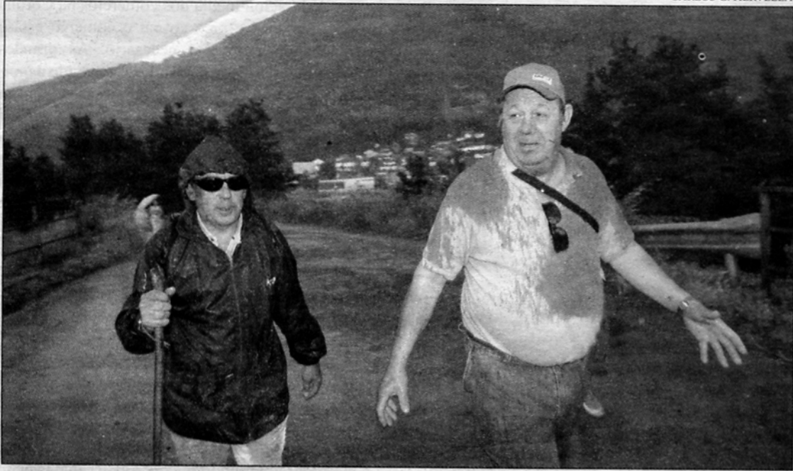
Aos camiñantes da ruta sur do Camiño de Santiago non os para nin o frío nin a chuvía.