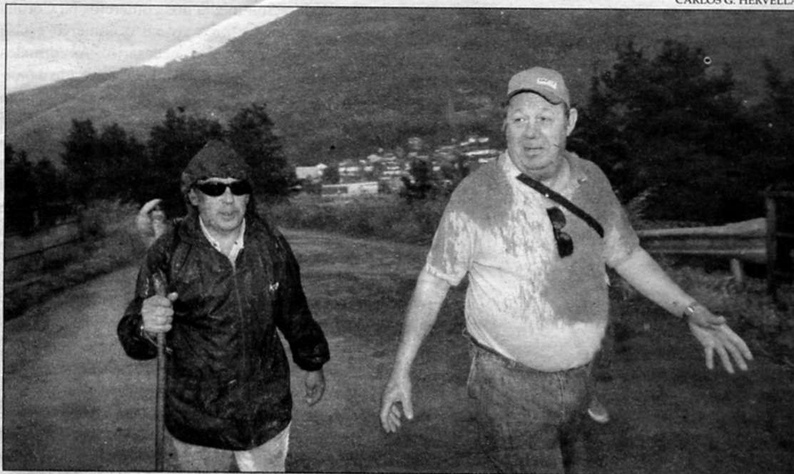
Aos camiñantes da ruta sur do Camiño de Santiago non os para nin o frío nin a chuvía.